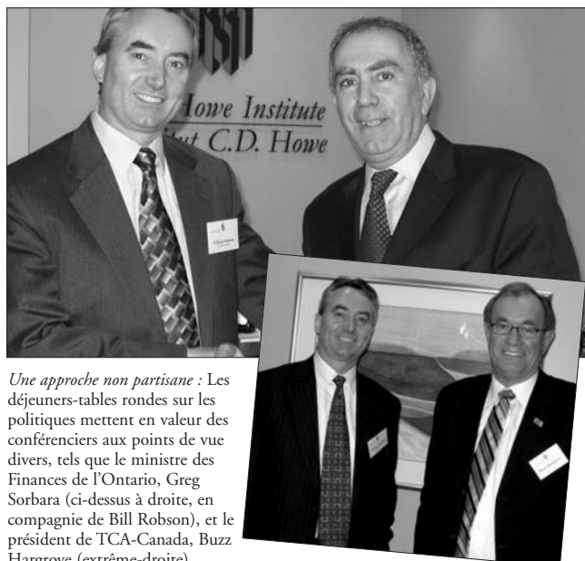
Une approche non partisane : Les déjeuners-tables rondes sur les politiques mettent en valeur des conférenciers aux points de vue divers, tels que le ministre des Finances de l'Ontario, Greg Sorbara (ci-dessus à droite, en compagnie de Bill Robson), et le président de TCA-Canada, Buzz Hargrove (extrême-droite).